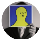
ぶつぐ(大畑 省吾) Ohata Shogo

1991年、寺田みさことダンスユニットを結成。2002年、「TOYOTA CHOREOGRAPHY AWARD 2002」にて、「次代を担う振付家賞」(グランプリ)、「オーディエンス賞」をW受賞。2004年、京都市芸術文化特別奨励者。2008年度文化庁・在外研修員として、ドイツ・ベルリンに1年滞在。近年はソロ活動を中心に、ドイツの障がい者劇団ティクパとの「Thikwa+Junkan Project」、京都・舞鶴の高齢者との「とつとつダンス」、宮城・関上(ゆりあげ)の避難所生活者への取材が契機となった「猿とモルターレ」等を発表。著書に「老人ホームで生まれたとつとつダンス」ーダンスのような、介護のようなー(晶文社)。